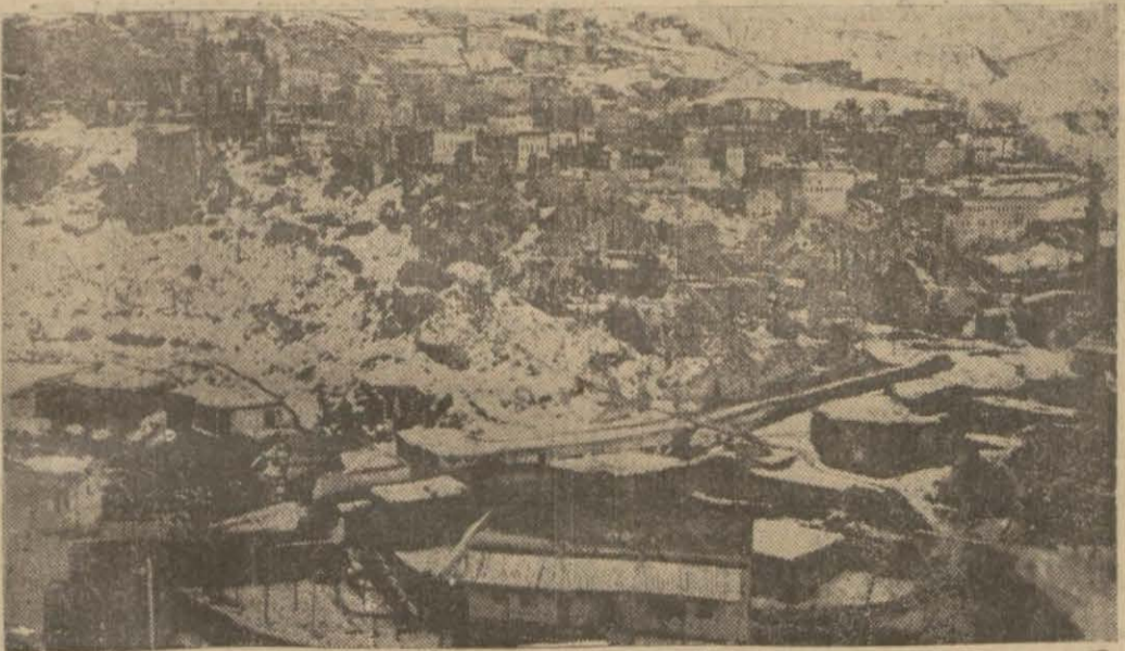
Karlara gömülen şark beldelerimizden Bitlis

Soğuktan Bütün Vahşî Hayvanlar Uyuştu, Koyun Sürüleri Aç Kaldı