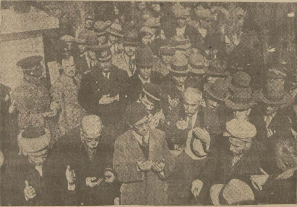
Dünkü İhtifalden bir intiba

Dün 16 Mart Şehitleri Bir Daha Tebcil Ve Taziz Edildiler