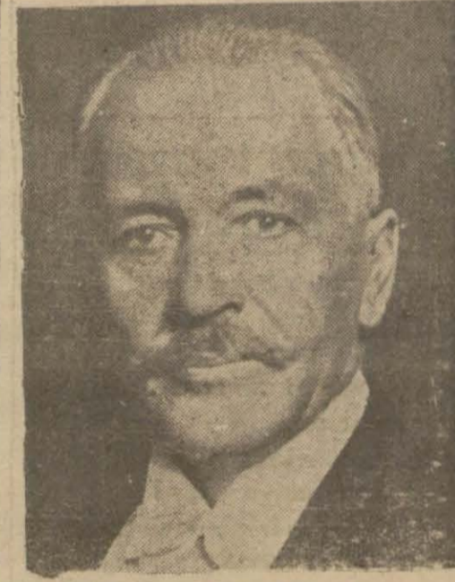
Lehistan Cümhar Reisi M. İngas Mosiski

Paris, 17 (Husus) — Lehistanın Yukarı Silezya kısmında Yahudilere karşı kanlı tecavüzlere girişildiği hakkında buraya çok heyecanlı haberler gelmektedir. Bu tecavüzlerin Yukarı Silezyanın Alman ehali tarafından tertip edildiği öğrenildikten sonra mesele bir kat daha mühimleşmiştir. Verilen tafsilattan çıkarılan manaya göre, Yukarı Silezya Almanlarının geniş mikyasta bir Yahudi katliamı teşebbüsünde bulduklarına inanmak lâzım geliyor. Almanyada Musevi aleyhtarları olan Hitler fırkasının iktidar mevkiine geçmesiyle birlikte zuhur eden bu kanlı hadiseler siyasi mahafilde son derecede ehem-