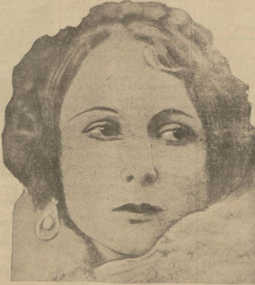
Katil kadın Jermen Huö

Bu usul yalnız arılar için değil bütün böcekler ve tırtıllar için de faydalıdır. Yalnız koruklar kemale gelmeye yani üzümler şekerlenmeye başladığı bir zamanda bu keseleri kullanmalıdır.