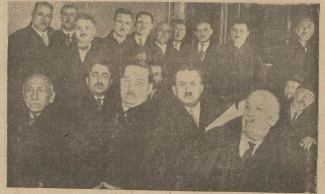
İstanbul avukatlarından bir kısmı toplantı halinde barosundan ayrılıp şimdilik Üsküdar ve Beyoğlu kazalarında

İstanbul Barosuna mensup avukatlar arasında ve bilhassa avukatlar ile inzibat meclisi arasında çıkan birtakım ihtilâflar üzerine İnzibat Meclisi reisi ve azalarının hepbirden istifa ettiklerini haber vermiştik. Bu istifa hâdisesi karşısında ihtilâfların halledilmesi için çalışılmaktadır. Fakat bize verilen malûmata göre ihtilâflar gün geçtikçe derinleşmekte ve birtakım ayrılıklara yol açmaktadır. Mevsuk bir membadan öğrendiğimize göre, avukatlardan bir kısmı yeni bir baro tesisi için teşebbüse girişmişler, hatta bunlar kendi aralarında bu hususta konuşmalar bile yapmışlardır. Bu konuşmalar arasında bazı avukatlar İstanbul